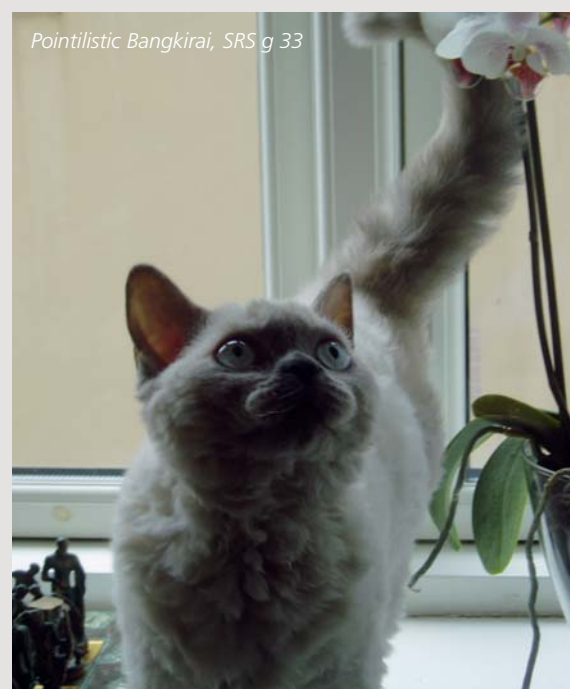
Pointilistic Bangkirai, SRS g 33

Genet hos Selkirk Rex, som giver den krøllede pels, er dominant. Når man parrer en Selkirk Rex med en