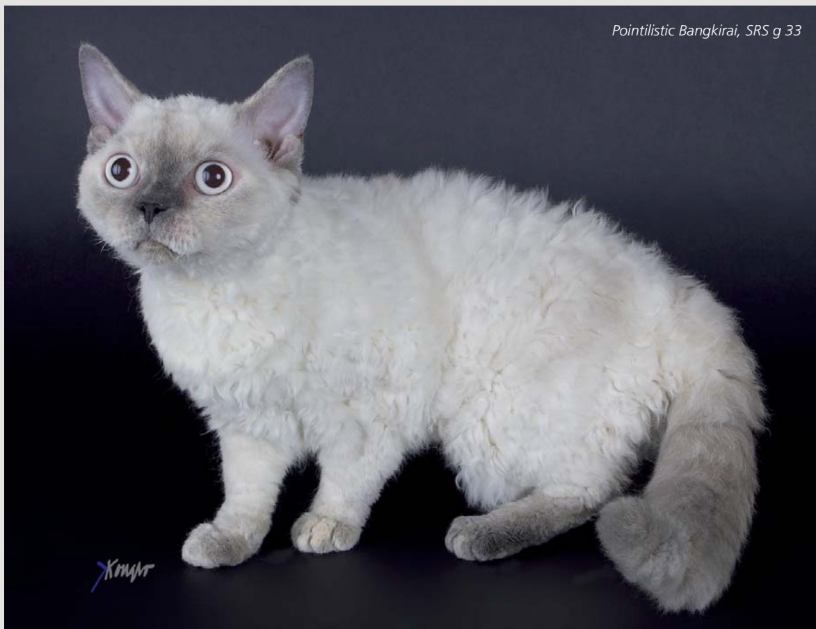
Pointilistic Bangkirai, SRS g 33