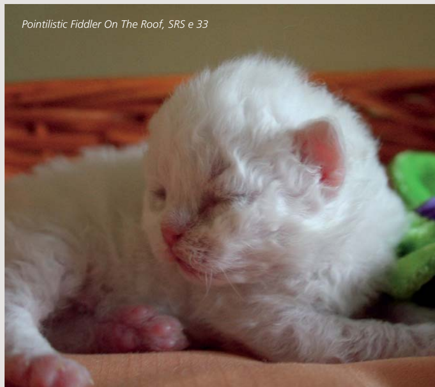
Pointilistic Fiddler On The Roof, SRS e 33

holde hende, men nu havde hun ombestemt sig. Jeg var ikke længe om at sige ja tak til at købe Yasmin.