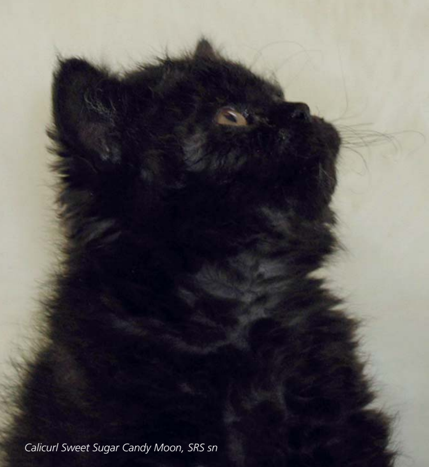
Calicurl Sweet Sugar Candy Moon, SRS sn