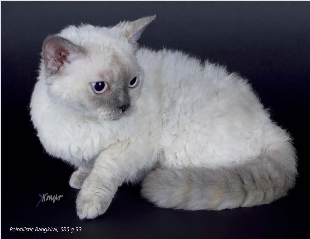
Pointilistic Bangkirai, SRS g 33

igen over Selkirk Rex, men denne gang var det en korthåret. Det var en utroligt smuk rød Selkirk Rex-han – jeg var solgt.